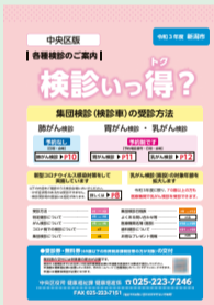
各種健診のご案内「検診いつ得?」