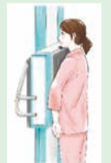
肺がん検診のイメージ 中央区健康づくりサポーター 中央子(なかちかこ)