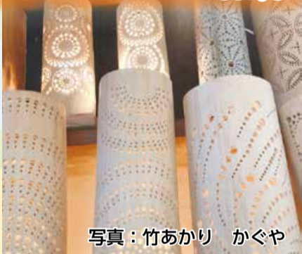
写真：竹あかり かぐや