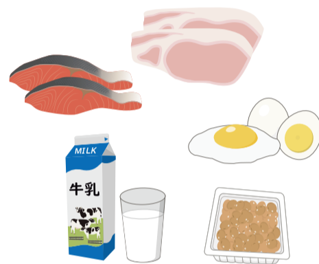
筋肉のもとになるたんぱく質を多く含む食品