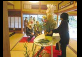
いけ花ライブの様子

回 10月30日、11月13日・27日(いずれも日曜) ①午前11時～11時30分 ②午後2時～2時30分 ※終了時刻は前後する場合あり 内 日本の伝統文化「茶の湯」のお点前を披露