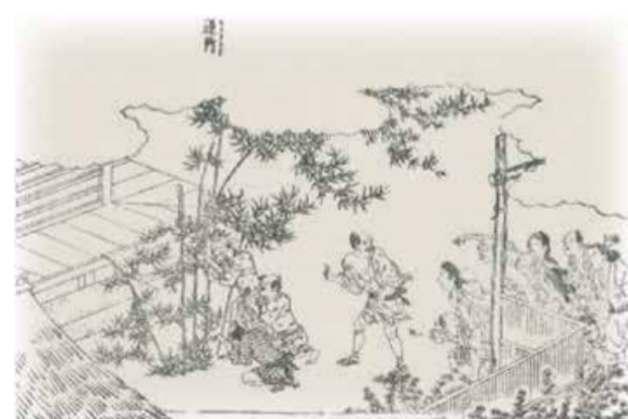
逆ダケを拝む人々 『二十四輩順拝図会』[享和3(1803)年]より