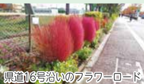
県道16号沿いのフラワーロード

現在、大通り沿いに花を植える取り組みをしています。この「フラワーロード」は、児童だけでなく地域の人にも楽しんでもらっていますね。今後は、同校の卒業生や、普段は小学校と関わることの少ない地元の人たちと協力できないか、と考えています。小学校の中だけでなく、地域全体の人々を繋ぎ、引き合わせられるような学習機会を作っていきたいです。