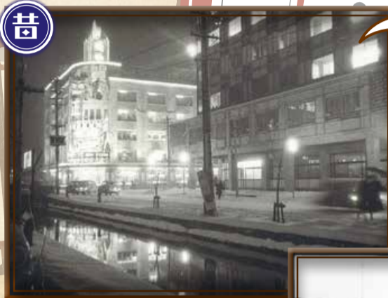
▲小林百貨店(写真左側)と旧新潟市役所本庁舎(写真右側)