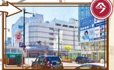
▲旧新潟三越(写真左側)とNEXT21(写真右側)