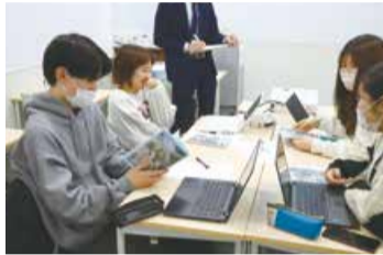
▲和気あいあいと話し合う学生