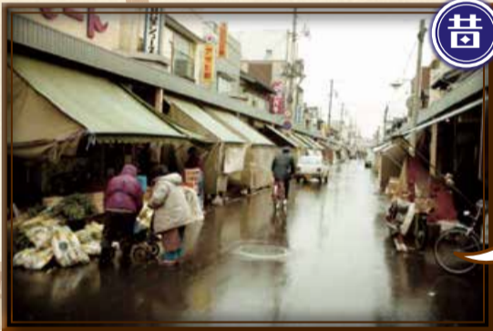
▲昭和57年ごろの様子