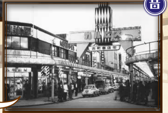
▲昭和42年ごろの古町通5番町