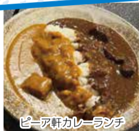
ピア軒カレーランチ

創業100年を迎えた西洋料理店ピア軒のランチはえんでこだけの提供メニュー。変わりゆく新潟駅内に店を構える魚沼釜蔵では、名物たれかつ丼で新潟の味を満喫。