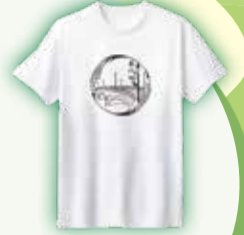
昨年度のデザイン

萬代橋誕生祭の開催を記念して作成するTシャツデザインを5月31日(金)まで募集しています。詳しくは右下の二次元コードから確認してください。