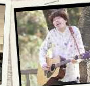
原生真 新潟出身のシンガ ーソングライター