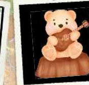
金成 洋 新潟市政策調整課