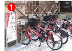
1 にいがた2kmシェアサイクル