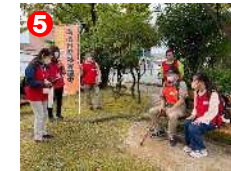
5 地域での徘徊模擬訓練