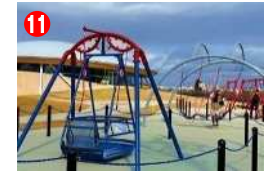
11 インクルーシブ遊具