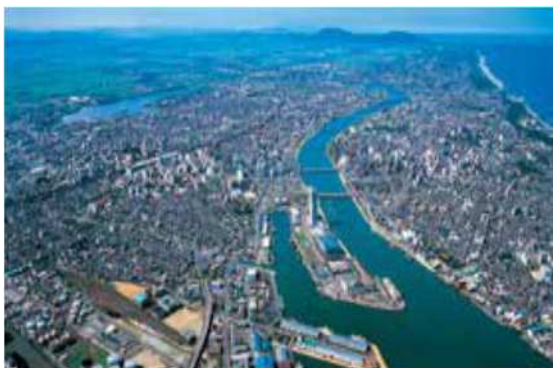
上空より区内を望む

○区内では土地の高度利用が進み、様々な都市機能が集積しています。一方で、国の重要文化財である萬代橋や、みなとまちの歴史的建造物など、伝統的文化を感じることでできるまちなみも存在しています。