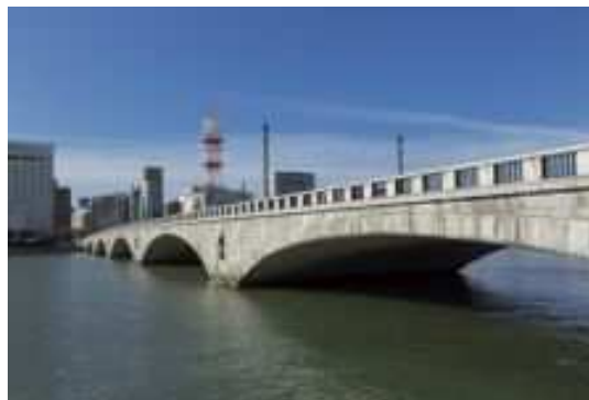
重要文化財萬代橋