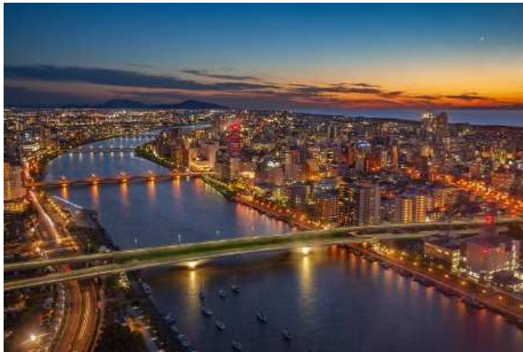
整備された道路網