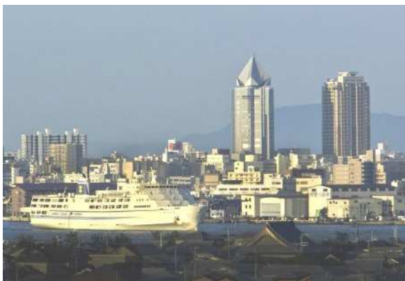
佐渡汽船とまちなみ