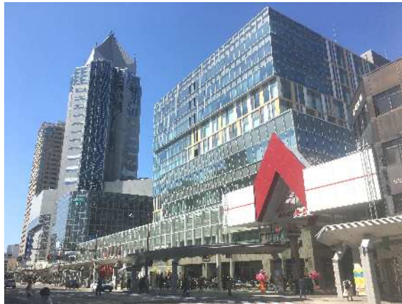
中央区役所（NEXT21）と新潟市役所ふるまち庁舎（古町ルフル）