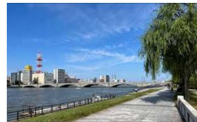
萬代橋と信濃川やすらぎ堤