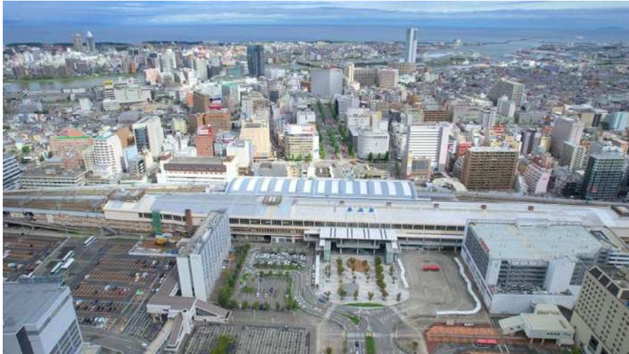
新潟駅周辺・万代・万代島・古町をつなぐ「にいがた2 km」