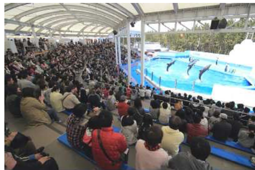
マリニピア日本海