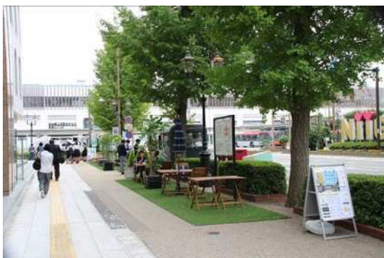
東大通“人中心の空間づくり”社会実験