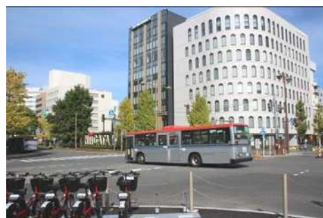
市内を走るバスとシェアサイクル