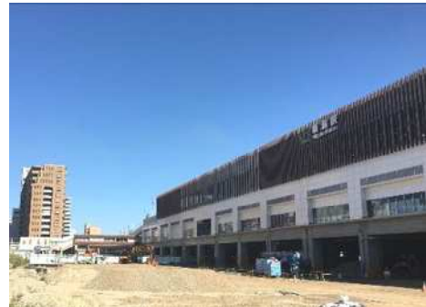
工事が進む新潟駅新万代広場