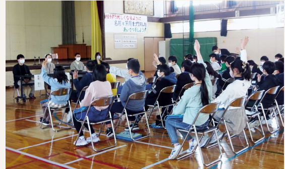
男女共同参画事業