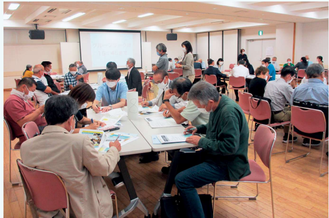
「持続可能な地域づくり支援事業」研修会