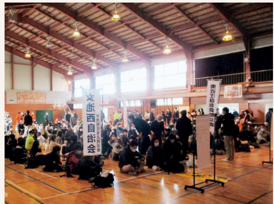
地域での連携防災訓練