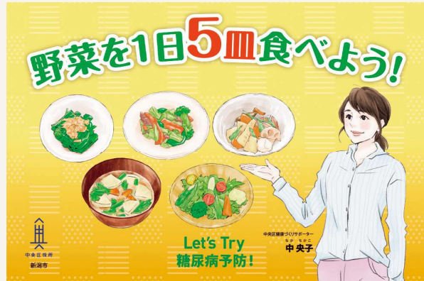
生活習慣病予防（食生活改善）の啓発