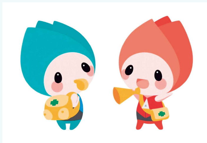
新潟市防災マスコットキャラクター「ジージョ・キージョ」