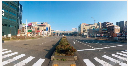
無電柱化された道路