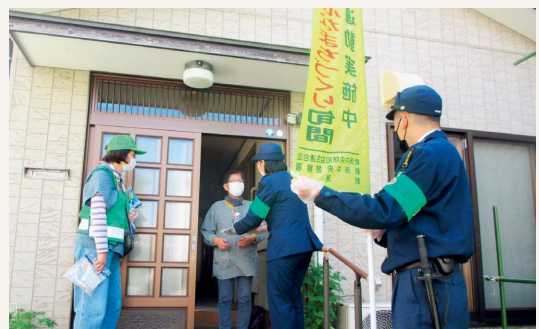
防犯に関する啓発活動