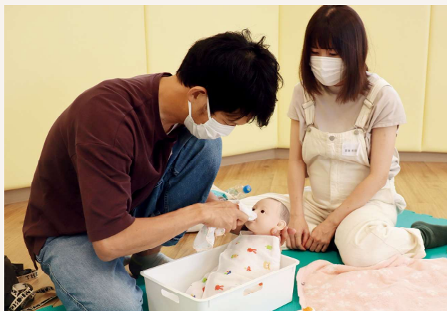
沐浴体験のようす