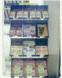
新潟市観光情報館 パンフレットの設置