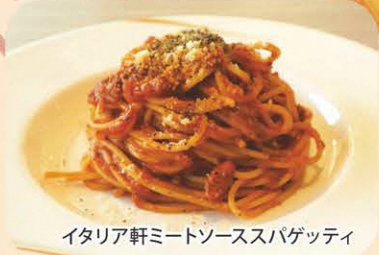
イタリア軒ミートソーススパゲッティ