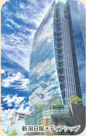
新潟日報メディアタワー