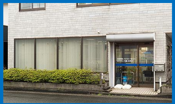
平成29年度グッドカンパニー掲載企業