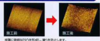
被膜に微細な凹凸を形成し、滑りを防止します。