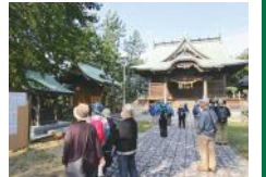
昨年度開催時の様子