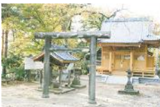
岡山どんぐり山公園