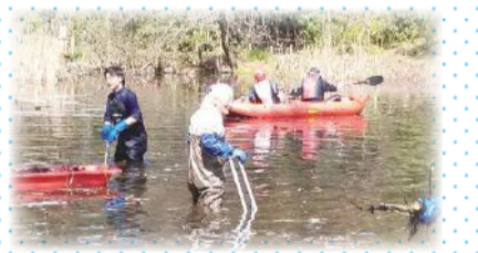
じゅんさい池環境保全活動

学生が地域から学び、それを広く社会に活かす力が育まれていくことを期待しています。