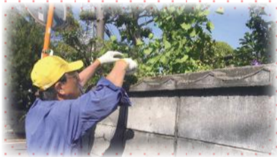
思いやり応援隊の活動

今後も、東区の課題の把握と解決に向けた支え合いのしくみづくりを地域の皆様と進めていきたいと思ひます。