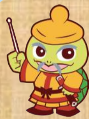
東区公認キャラクター 東区応援団長「めたりん」

高齢期は、健康や生きがい、仲間づくり、地域に役立つことを心掛けていくことで、充実した時間を過ごすことができるはず。一人一人が輝いて生きる、そのお手伝いをしているところが老人クラブです。