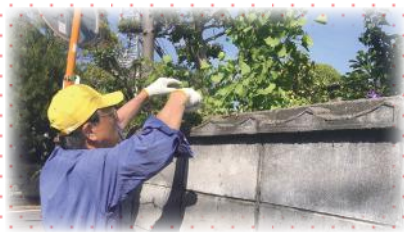
思いやり応援隊の活動

今後も、東区の課題の把握と解決に向けた支え合いのしくみづくりを地域の皆様と進めていきたいと思ひます。