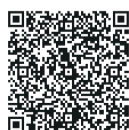
参加飲食店一覧はこちら