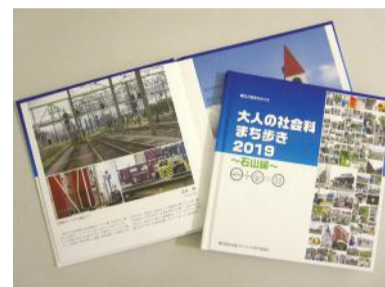
アルバム完成イメージ(2019年版)

後日、撮影した写真を使って、サポートを受けながらアルバム本の1ページを作ります。また、撮影写真をパネルにし、写真展も開催します。