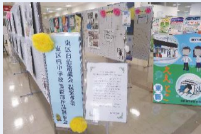
美術部作品展示会の様子

8月6日(木)～8月26日(水)に、区役所南口エントランスホールで、東新潟中学校・石山中学校・東石山中学校の美術部の作品展示会を開催しました。期間中には、多くの来庁者が作品を観覧する様子が見られました。