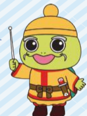
東区応援団長 めたりん

かき分け除雪 を基本としています。自宅前は各家庭で除雪をお願いします。自力で作業できない場合は地域の皆様のご協力をお願いします。