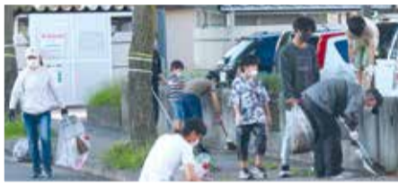
▲自治会活動(クリーン作戦)の様子

自治会・町内会役員や運営者の業務内容の現状を調べ、実際に活動している住民の声を聞いたり、他都市の事例を研究したりするなどして、令和4年度に実施する事業を検討しています。