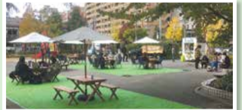
▲公園の利活用の事例/令和2年度(中央区 弁天公園における社会実験)

地域にある身近な公園の利活用について、検討しています。管理や活用の事例について市・区役所の担当部署にヒアリングを行い、令和4年度にどのような事業を実施すべきか協議しています。