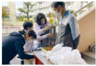
▲子ども食堂(お弁当の配食)の様子

子どもの育ちと地域の関わりについて、有識者などから話を聞いて理解を深めます。また、子ども食堂の現状や課題を調査し、支援のあり方を協議しています。