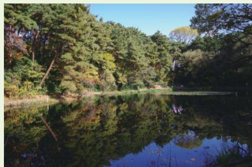
園芸スイレン除去作業後(令和2年11月撮影)