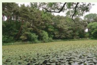
園芸スイレン除去作業前(令和2年5月撮影)

夏にはきれいな花を咲かせる園芸スイレンですが、生態系に影響を及ぼす恐れのある重点対策外来種に指定されています。じゅんさい池の環境整備を考えていく上で課題の一つとなっています。