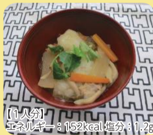
【1人分】エネルギー：152kcal 塩分：1.2g

食べ過ぎ、飲み過ぎが気になるこの時期、消化促進効果のある長イモを使った料理はいかがですか。