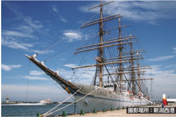
撮影場所：新潟西港