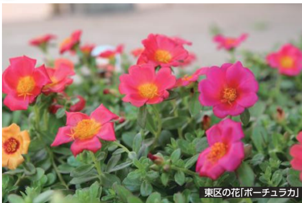
東区の花「ポーチュラカ」