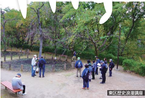
東区歴史浪漫講座