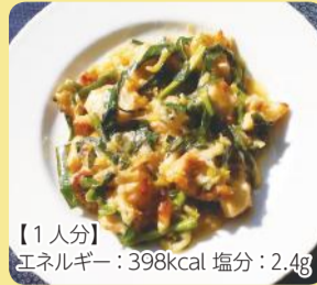
【1人分】 エネルギー：398kcal 塩分：2.4g

ネギやニラは風邪予防の手助けになります。ニンニクには疲労回復や体力増進の効果もあります。