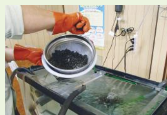
▲ホタルの幼虫に餌をやる様子

ここで見られるホタルは、年間を通じて別の場所で人工飼育し、時期が来たら放流しているものです。飼育には知識と経験が必要となりますが、担い手確保の課題などにより、継続が難しくなっています。