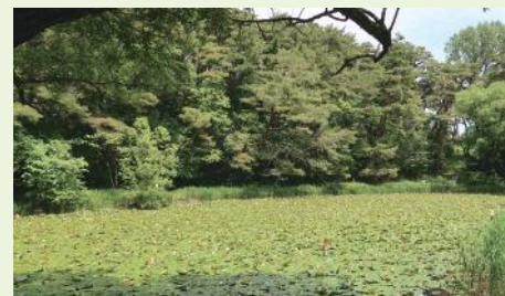
▲しばらく経つとまた繁茂してしまいます(令和3年5月撮影)