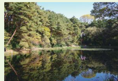
▲刈り取り後の様子(令和2年11月撮影)

今年度も刈り取りなどの環境整備活動を行う予定ですが、水底の地下茎で増え、繁殖力の強い園芸スイレンは、一度刈り取っても数カ月でまた広がってしまい、完全に取り除くことは困難な状況です。