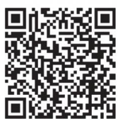
これまでの協議内容や資料はこちらから

日時 7月29日(木)午後2時から 会場 東区プラザ 定員 先着5人 問い合わせ 地域課(☎025-250-2110) ※6月の全体会議は休会します