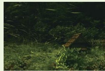
▲じゅんさい池で舞うホタル

東池に接する傾斜地に整備された「ホタルの里」では、毎年、6月下旬から7月上旬にかけて、ゲンジボタルが舞い、幻想的な光景が見られます。