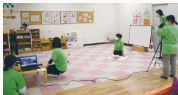
▲モニター越しに親子ふれあい遊びを開催

5月6日、わいわいひろばでウェブを活用したリモートのふれあい遊びが開催されました。これは、今年度の特色ある区づくり事業である「ウェブでつながるマタニティ期からの子育て応援事業」の一環