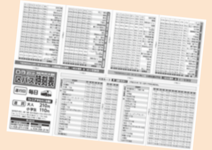
▲(左)区バス運行ガイド(A4サイズ) (右)ポケット時刻表(仕上がりA7サイズ) 区役所地域課(43番窓口)や区バス車内、区内公共施設などに設置しています