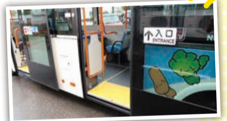
新しい車両の乗降口