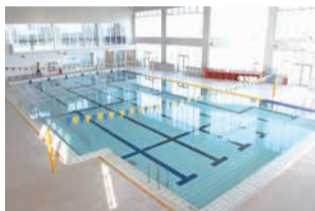
屋内プール (下山スポーツセンター)

スポーツ施設の利用には、当日券や回数券が利用できる他、定期券も販売しています。定期券は施設種別によって、市内共通で利用することができます。詳しくは各施設へお問い合わせください。