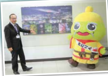
石井区長とめたりんで、早速撮影してみました!