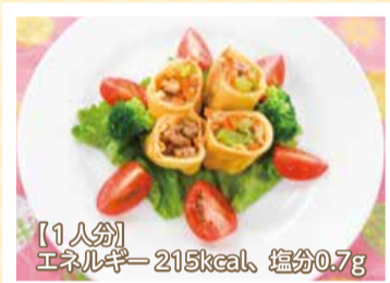
[1人分] エネルギー 215kcal、塩分0.7g