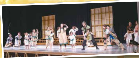
東区市民劇団「座・未来」による歴史浪漫あふれる音楽劇を上演しました。