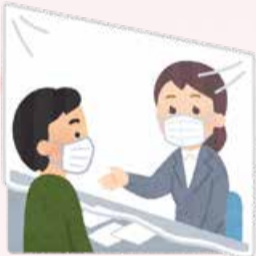
(例) 昨年の国民健康保険加入(5番窓口)利用者数