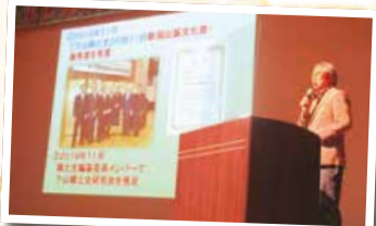
区内歴史サークルの活動発表や、東区が有力な候補地とされる湊足柵などについて専門家による講演を行いました。