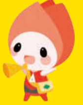
新潟市防災 マスコットキャラクター キョージョ

58年前の6月16日、新潟地震が発生し、家屋倒壊・地割れ・浸水・火事など各地に甚大な被害を及ぼしました。地震以外にも、6月～10月は、台風や集中豪雨などによる洪水が発生する可能性が高くなる出水期のため、注意が必要です。