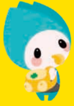
新潟市防災 マスコットキャラクター ジージョ