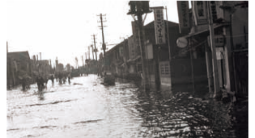
新潟地震による津波浸水被害