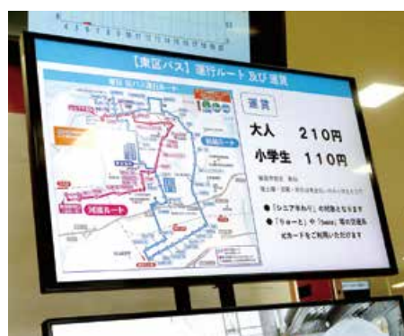
▲大型モニターによる表示(土日・祝日を除く)