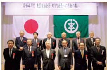
当日出席された皆様