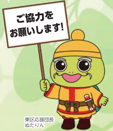
東区応援団長 ぬたりん

窓口が混みやすい月曜や金曜などを避けるか、臨時窓口や郵送手続き、マイナンバーカードでの手続き(オンラインやコンビニ交付)をご利用ください。