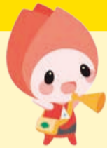
新潟市防災 マスコットキャラクター キョージョ

59年前の6月16日、新潟地震が発生し各地に甚大な被害を及ぼしました。 また毎年、6月～10月は、台風や集中豪雨などによる洪水が発生する可能性が高くなる出水期のため、注意が必要です。 災害はいつ起こるか分かりません。災害から自分や家族の命を守るために、普段から情報収集を行い、防災訓練に積極的に参加しましょう。