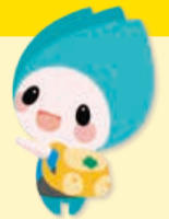
新潟市防災 マスコットキャラクター ジョージョ

59年前の6月16日、新潟地震が発生し各地に甚大な被害を及ぼしました。 また毎年、6月～10月は、台風や集中豪雨などによる洪水が発生する可能性が高くなる出水期のため、注意が必要です。 災害はいつ起こるか分かりません。災害から自分や家族の命を守るために、普段から情報収集を行い、防災訓練に積極的に参加しましょう。