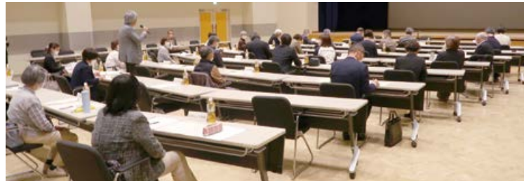
令和5年度 東区自治協議会 全体会議の様子