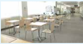
中地区公民館フリースペース

7月23日(火)~ 8月29日(木)の期 間中、「学習室・子 どもの居場所」を 開設します。