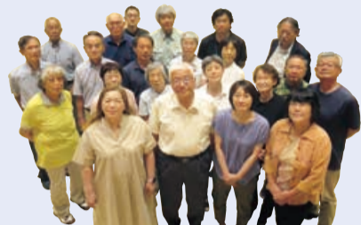
委員一丸となって頑張ります (令和6年6月27日開催の全体会議出席の委員を撮影)

令和6年4月25日、東区プラザホールにて第1回東区自治協議会を開催し、令和6年度の活動をスタートしました。区民の皆様と行政との「協働の要」として、昨年度実施した「東区民意調査」の結果を踏まえつつ、より住みやすい東区を目指して様々な活動に取り組んでいきます。