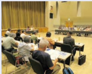
審議に取り組む様子