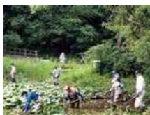
▲6月に東山の下地区コミュニティ協議会が実施した東池の保全活動の様子

ホタルもシンデレザクラも、長年親しまれてきた魅力の一つですが、これからのあり方を考える岐路にあります。