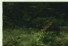
▲じゅんさい池で舞うホタル

東池に接する傾斜地に整備された「ホタルの里」では、毎年、6月下旬から7月上旬にかけて、ゲンジボタルが舞い、幻想的な光景が見られます。