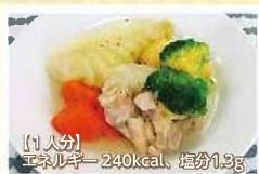
【1人分】 エネルギー 240kcal、塩分 1.9g