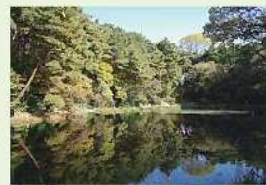
▲刈り取り後の様子(令和2年11月撮影)

今年度も刈り取りなどの環境整備活動を行う予定ですが、水底の地下水で増え、繁殖力の強い園芸スイレンは、一度刈り取っても数カ月でまた広がってしまい、完全に刈り除くことは困難な状況です。