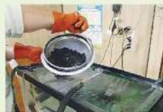
▲ホタルの幼虫に餌をやる様子

ここで見られるホタルは、年間を通じて別の場所で人工飼育し、時期が来たら放流しているものです。飼育には知識と経験が必要となりますが、担い手確保の課題などにより、継続が難しくなっています。