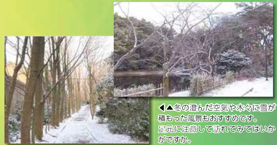
◀▲冬の澄んだ空気が木々に雪が積もった風景もおおすすめです。足元に注意して散策してみてください。