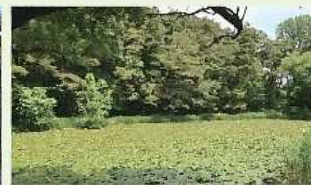
▲しばらく経つとまた繁茂してしまいます(令和3年5月撮影)