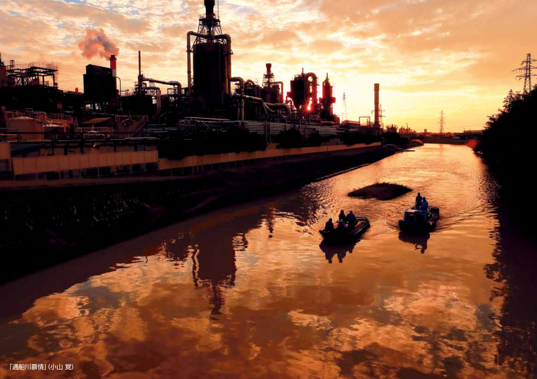
「通船川慕情」(小山 寛)