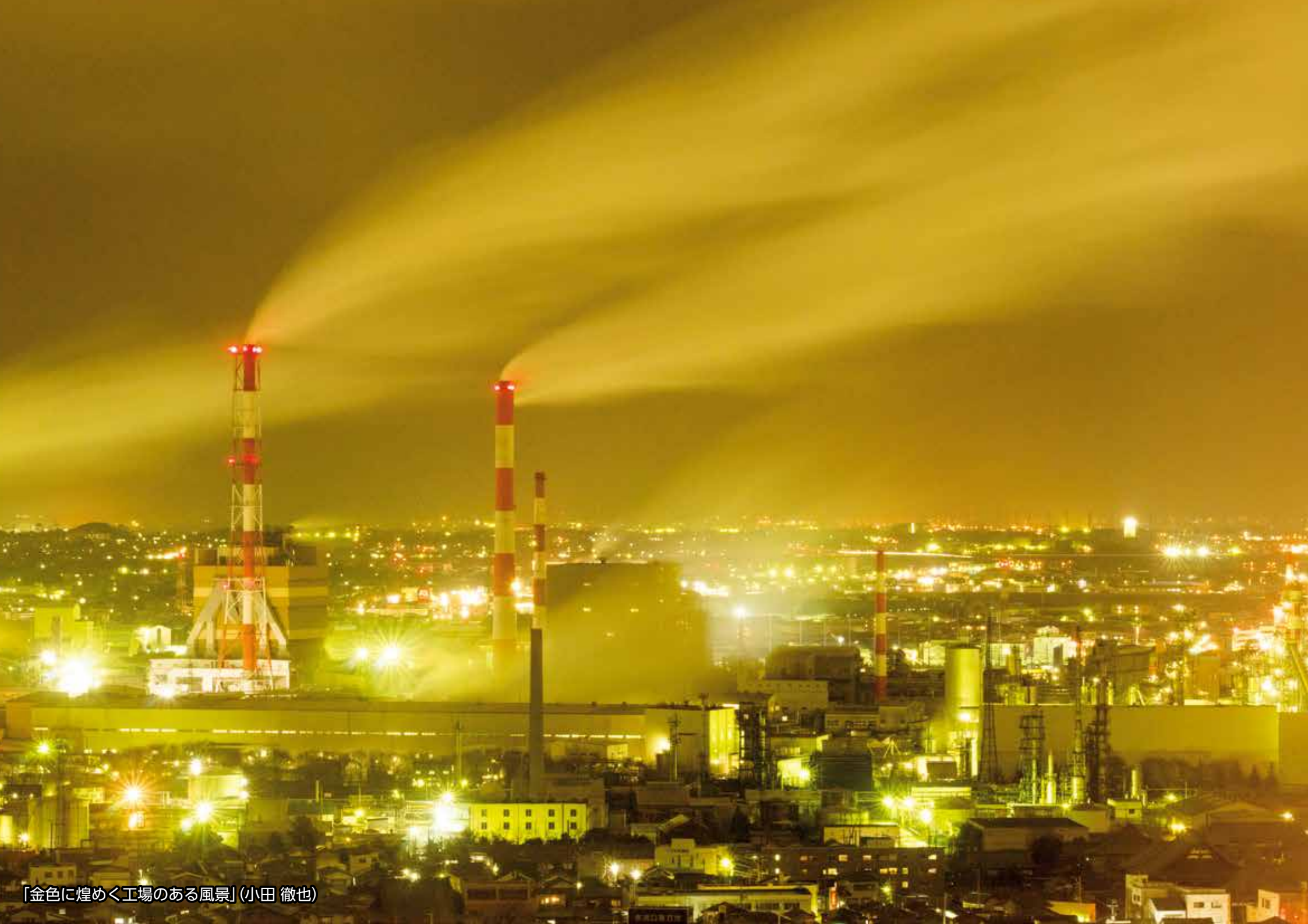
「金色に煌めく工場のある風景」(小田 徹也)