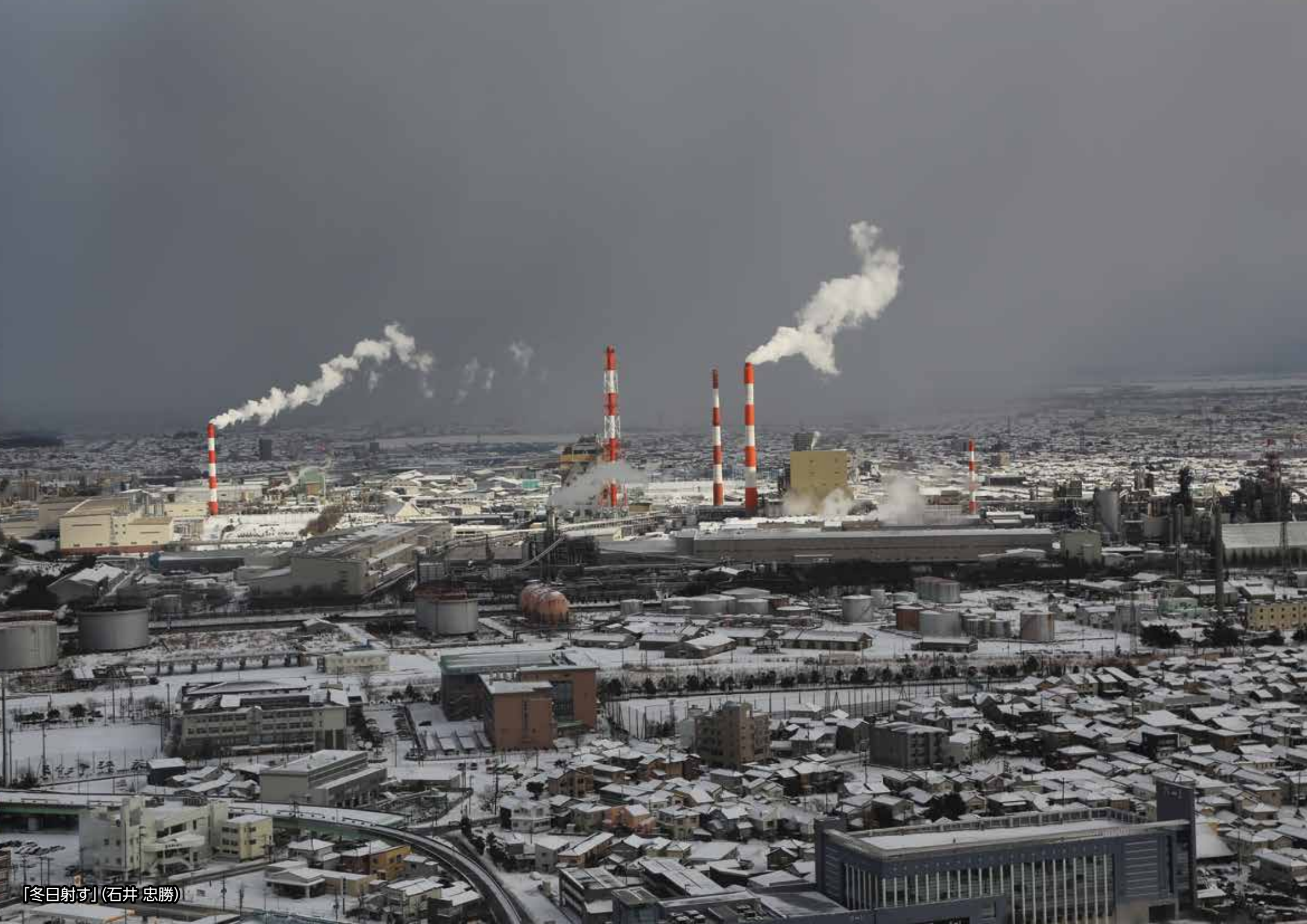
「冬日射す」(石井 忠勝)