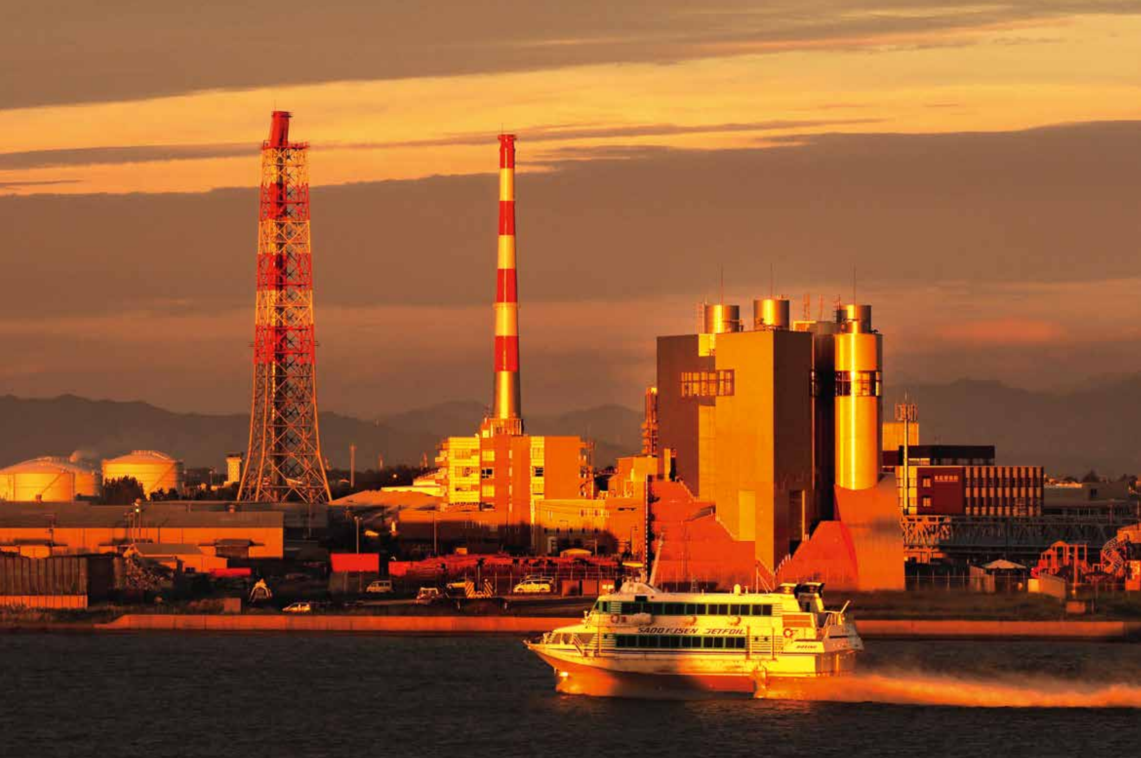
「夕焼けに染まる臨港」(石倉 盛夫)