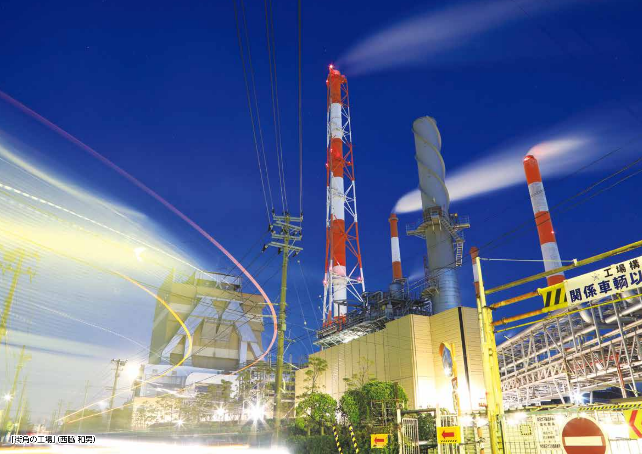
「街角の工場」(西脇 和男)