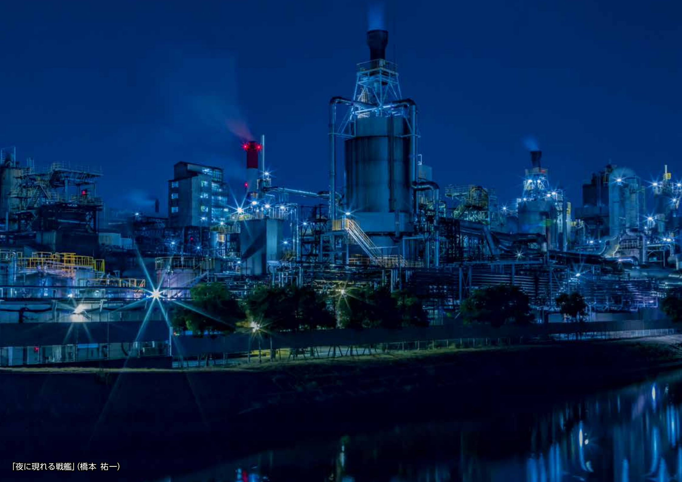
「夜に現れる戦艦」(橋本 祐一)