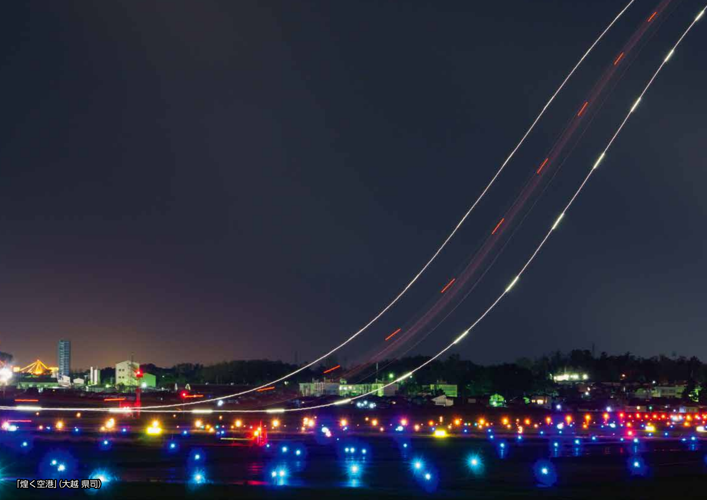
「煌く空港」(大越 県司)