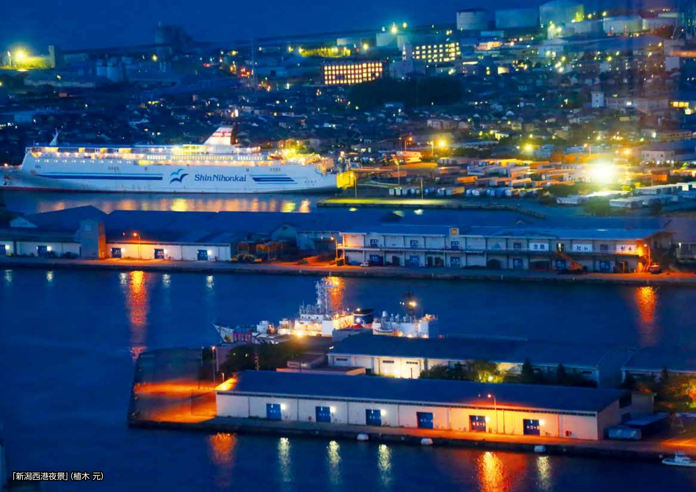
「新潟西港夜景」(植木 元)