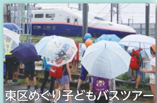
東区めぐり子どもバスツアー

また、来年度に向けて講師を招き、調査・研究を進めています。今後は新たな地域課題の解決に向けて取り組んでいきます。