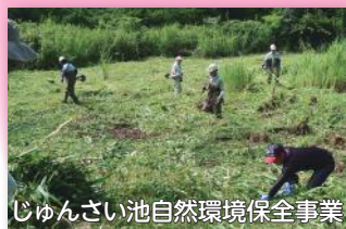
じゅんさい池自然環境保全事業

「じゅんさい池自然環境保全事業」では、昨年度に引き続き、葎や外来植物である園芸スイレンの刈取り作業を、自治会や地域コミュニティ協議会等の地域の皆さんと実施しました。