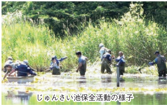
じゅんさい池保全活動の様子

地域における災害時の連絡体制の構築を重要課題と捉え、「発災時の地域防災体制支援事業」として、連絡体制を構築するためのワークショップと情報伝達訓練を実施します。また今年度は「じゅんさい池保全事業」にも取り組んでいます。じゅんさい池公園は、外来植物の繁茂や外来生物の繁殖により従来の生態系が侵されています。このため、地域コミ協や自治会、ボランティアや県立大学生など地域の力を結集して自然公園「じゅんさい池」の再生に取り組んでいます。