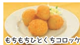
もちもちひとくちコロッケ