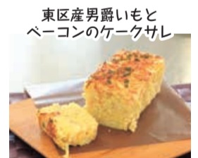
東区産男爵いもと ベーコンのケーキサレ