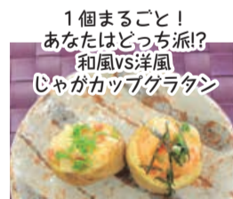
1個まるごと！ あなたはどっち派？ 和風vs洋風 じゃがカップグラタン