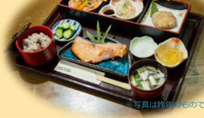
古代の食材を 美味しくアレンジ