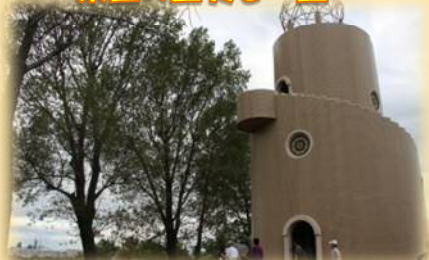
大山台公園の展望台