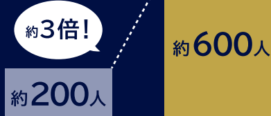
2016年 G7新潟 農業大臣会合 (約200人) vs 2016年 G7仙台 財務大臣・中央銀行総裁会議 (約600人)