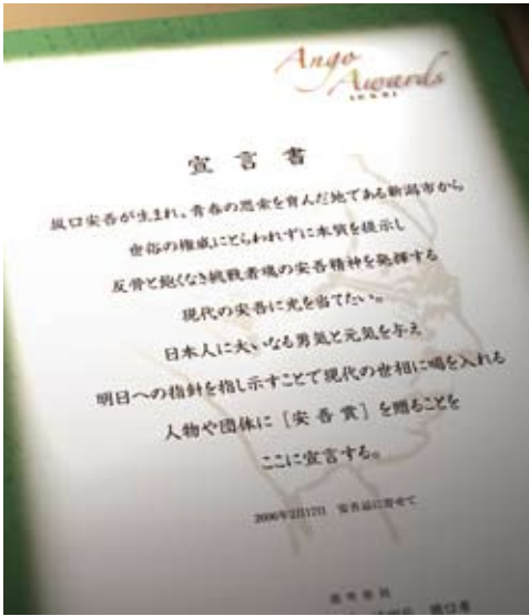
安吾賞宣言書 2006年2月17日 安吾忌に寄せて