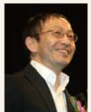
野田秀樹 第1回 安吾賞受賞

第5回安吾賞ご受賞おめでとうございます。長い間のご研究の成果が実を結ばれて、感無量でございます。今後とも一層ご活躍されますよう、お祈りいたします。