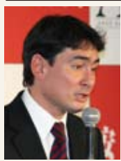
野口健 第2回 安吾賞受賞

第5回安吾賞ご受賞おめでとうございます。長い間のご研究の成果が実を結ばれて、感無量でございます。今後とも一層ご活躍されますよう、お祈りいたします。