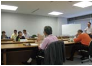
議論白熱の選考委員会風景

文壇デビュー 昭和六年一月、処女作『木枯の酒倉から』を発表。五月『ふるさと』に寄する讃歌、六月『風博士』を発表、牧野伸一が激賞。七月『黒谷村』を発表、島崎藤村などが賞賛し、新進作家として文壇に認められる。昭和七年の夏、新進女流作家の矢田津世子を知り烈しいプラトニッ