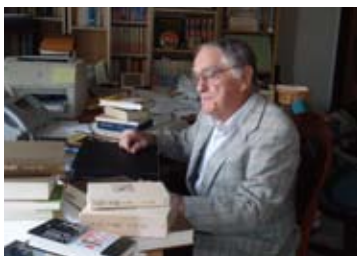
2010年10月：東京都北区の書齋にて

一九六二年・四十才／「菊池寛賞」受賞に際し、在日米国外交公使館前にて。ライシャワー大使、中央公論社社長嶋中鵬二氏、三島由紀夫氏などと共に。以後も精力的に日本文学・文化の研究に邁進し、多くの著作を著す。近年は一年の半分を米国と日本で暮らしている。