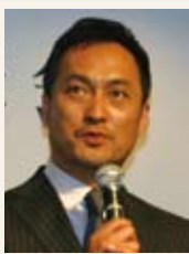
渡辺謙 第4回 安吾賞受賞