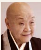
瀬戸内寂聴 第3回 安吾賞受賞

恐らく私以上に、日本を愛し理解している大先輩の旅に負けないよう、私もこれから日本の心を世界に知ってもらえる為に研鑽、努力しなければと、改めて勇気を戴いた気がしています。受賞本当におめでとうございます。