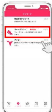
所属しているチームの メッセージをタップ