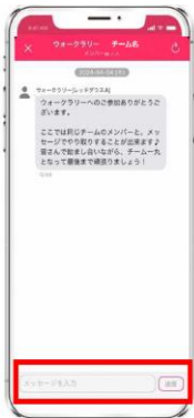
参加者へテキストでメッセージを お送りすることができます。