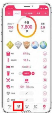
「メッセージ」をタップ