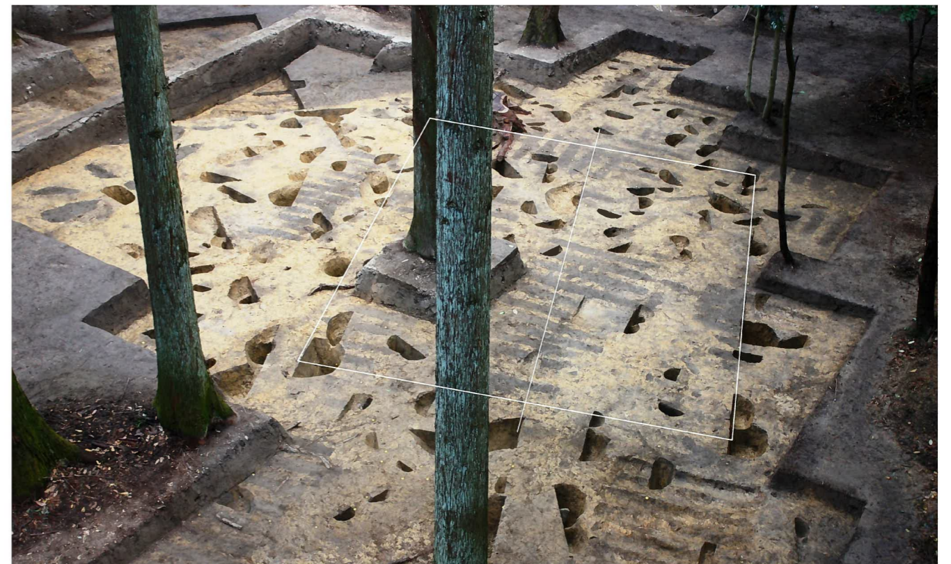
掘立柱建物 (SB1 南西から 平成 30 年度撮影)