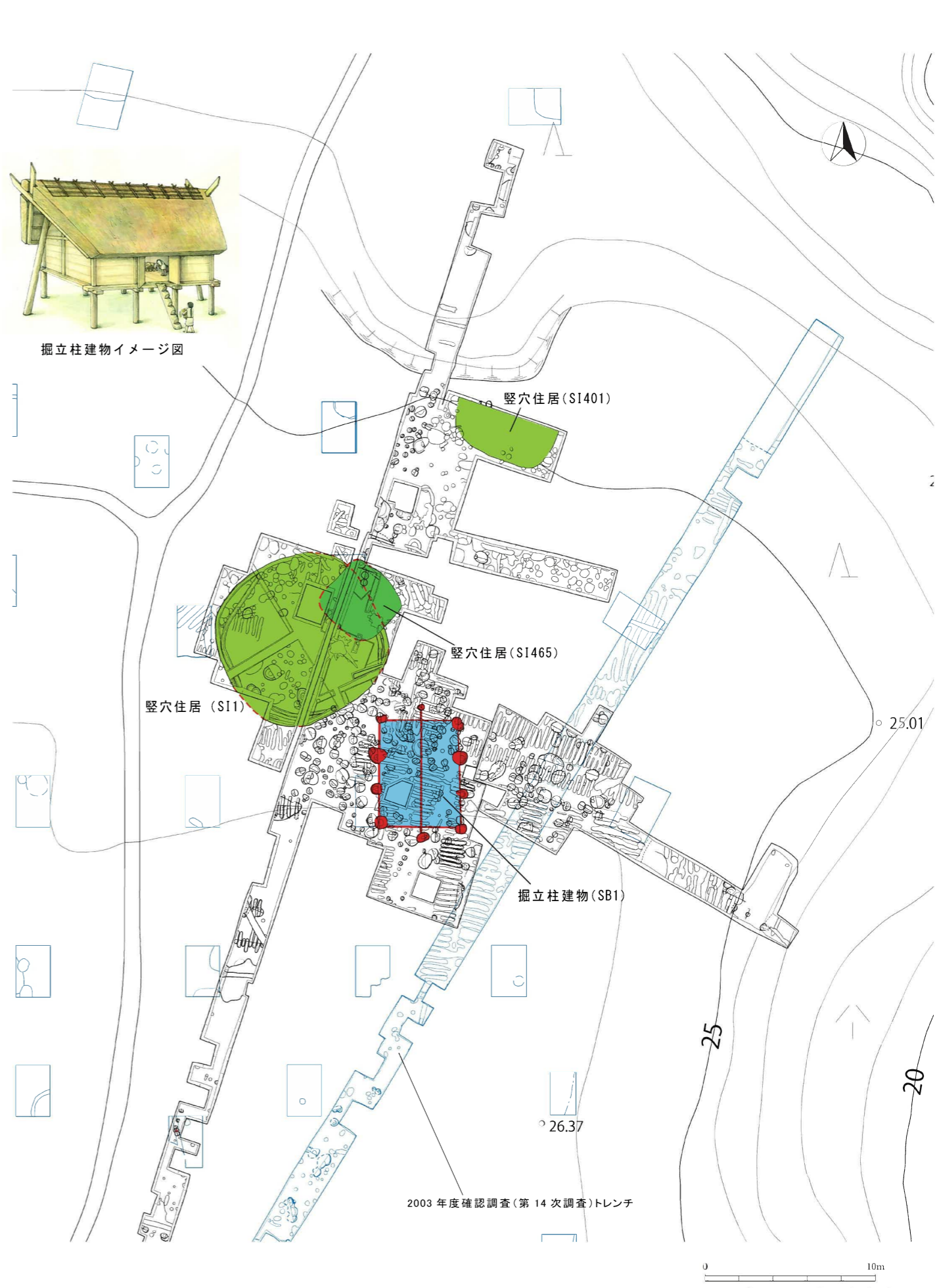
2017年～2019年発掘調査平面図