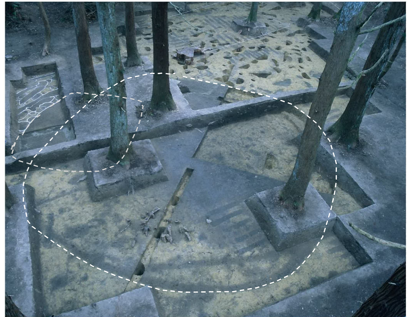
竪穴住居跡 (SI1・SI465) 全景（北西から・点線は竪穴住居推定ライン 平成 30 年度撮影）