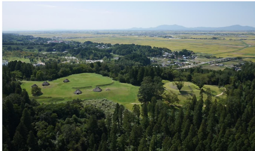
古津八幡山遺跡全景（北東から）

調査地は、丘陵頂部の集落の中心域より一段低い場所に位置しており、弥生時代においてこの場所がどのように利用されていたのか注目されます。