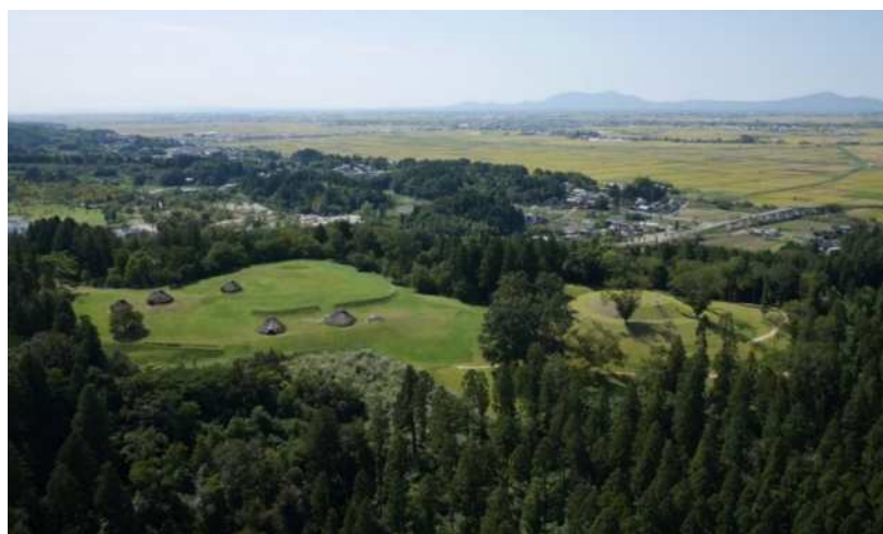
古津八幡山遺跡全景（北東から）

古墳時代になると丘陵上の集落は廃絶しますが、直径60mと県内最大の円墳で、越後平野の広い範囲を治めた豪族の墓と推測される古津八幡山古墳がつくられます。