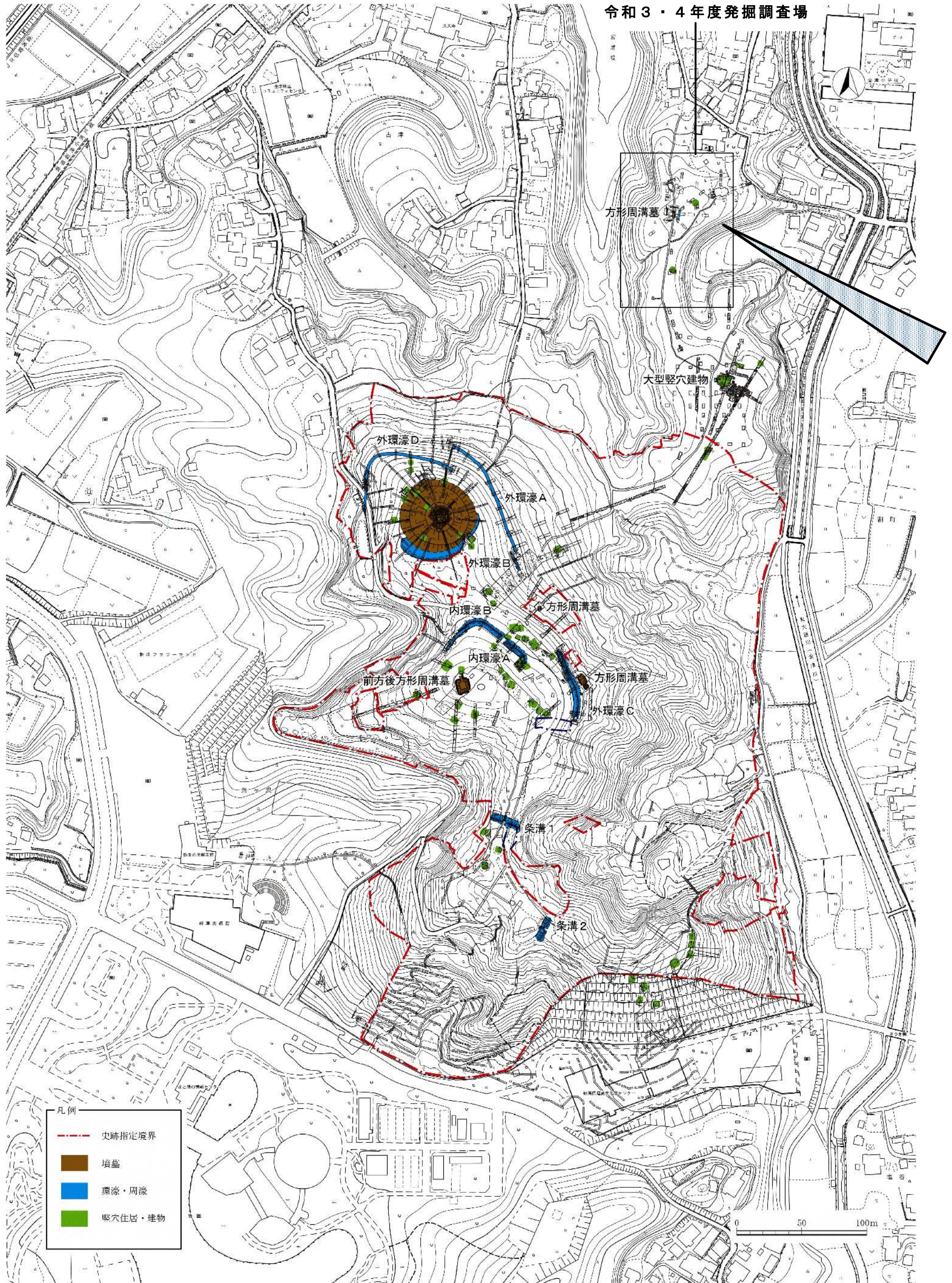
古津八幡山遺跡全体図