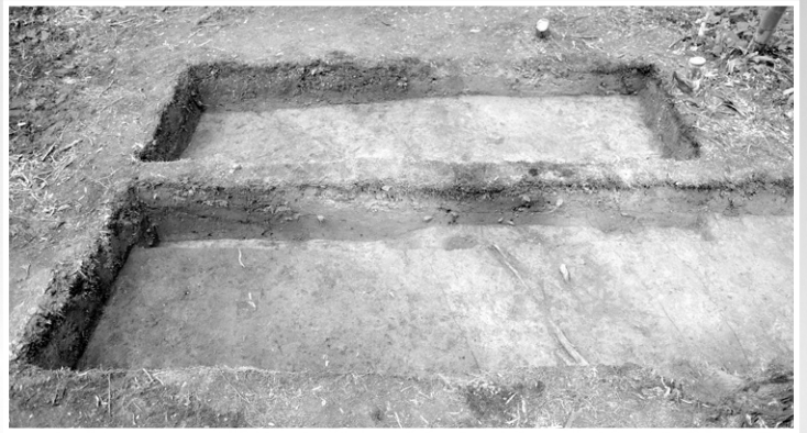
新たに見つかった竪穴建物(SI802)

国史跡古津八幡山遺跡では、史跡をより適切に保存・活用していくため、平成29年度から史跡指定地外においてさらなる遺跡の把握を目的とした確認調査を行っています。