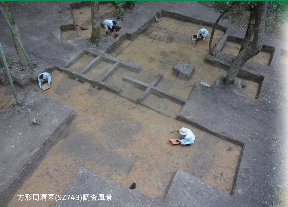
方形周溝墓(SZ743)調査風景