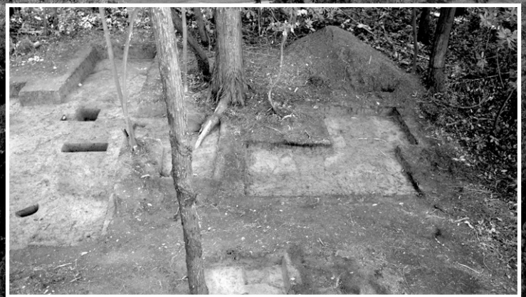
新たに見つかった方形周溝墓(SZ822)

結果、方形周溝墓(SZ743)の埋葬施設がさらに1基見付き、合計4基あることが確認されました。また、そのうちの中心埋葬施設は「木柵」構造であると推定されました。さらに方形周溝墓1基(SZ822)や竪穴建物2棟(SI802・821)などが新たに見つかりました。