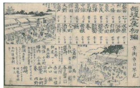
『越後土産初編』幕末には多くの市が開かれていた